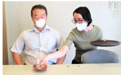
↑ひざを曲げ、目線を下げるのがポイント

湯茶接待は、ご来社いただいたお客様へのおもてなしの所作です。お盆の位置や目線の高さなど、注意する点はたくさんありますが、それらの正しい動作を毎回、