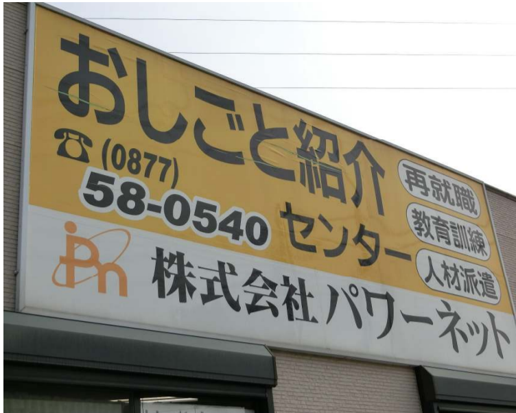
(株)パワーネット社屋