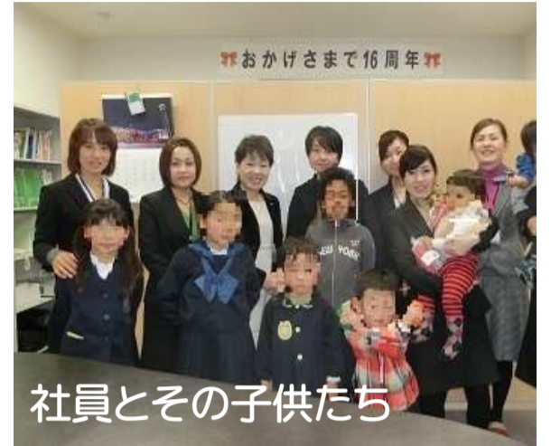
社員とその子供たち